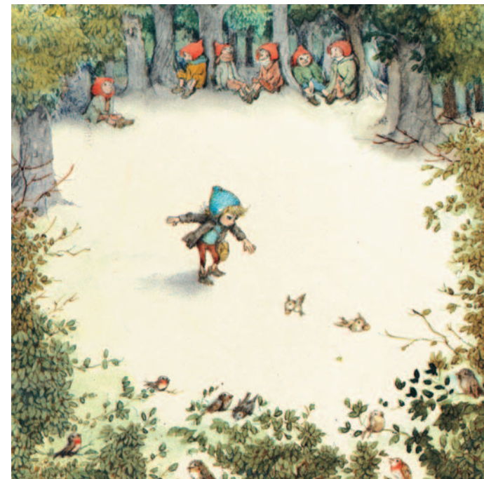
Il·lustració a la portada de Polzet , 1986