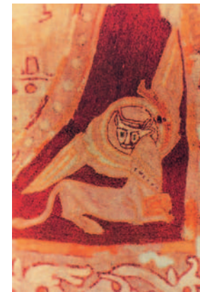
Estendard de Sant Ot (detall)