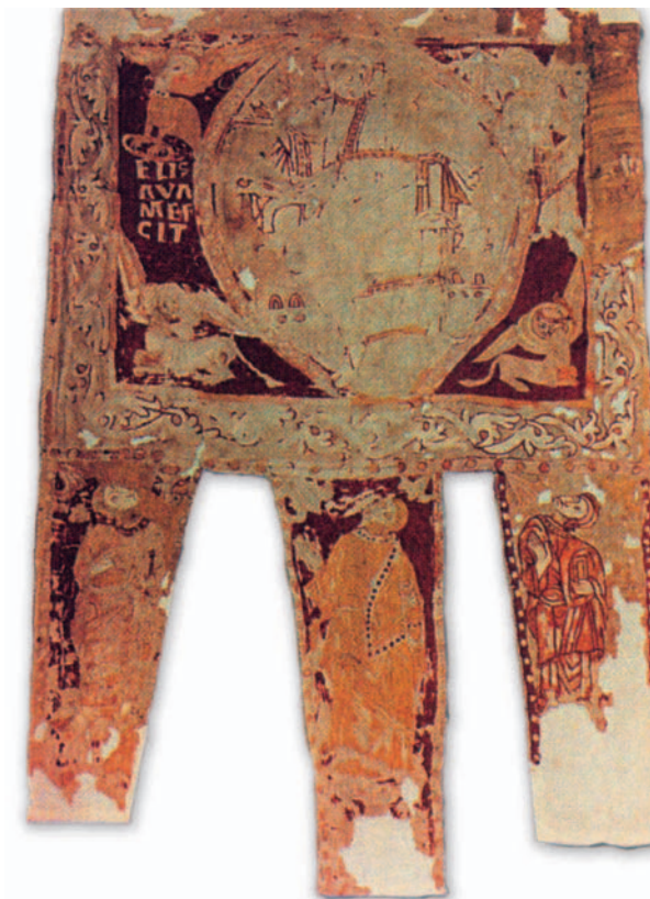
Estendard de Sant Ot, segle XIII