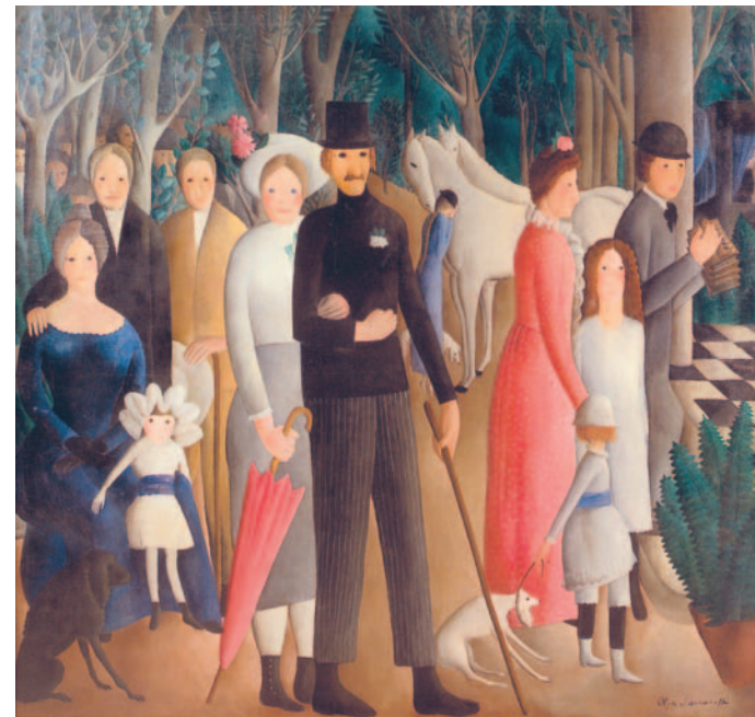
El casament , no datat