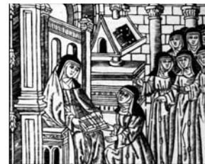
Isabel de Villena presentant la Vita Christi a les seves companyes en la sala capitular

Filla de l'escriptor i noble Enric de Villena i educada a la cort de la reina Maria de Castella, Isabel és considerada la principal figura femenina de la literatura medieval valenciana. En aquest sentit, cal destacar la seva obra Vita Christi , primer text català escrit en defensa de les dones. Com a artista va decorar el manuscrit Speculum animae –Mirall de l'ànima–, que ella mateixa va escriure entre el 1460 i el 1470. Aquesta darrera obra ha esdevingut el primer text conegut escrit i il·luminat per una autora catalana. Una bona part de les 63 miniatures que el componen il·lustra amb especial atenció els darrers moments de la vida de Crist. Cal assenyalar igualment que l'obra va ser realitzada per tal de fomentar la meditació de les monges de clausura destinat exclusivament a les dones i construït per l'arquitecta Sophie Hayden. El 1953 es va constituir la Fundació Guasch Coranty per tal de donar suport a l'activitat artística. Actualment atorga beques i ajuts per a l'alumnat de la Universitat de Belles Arts de Barcelona.