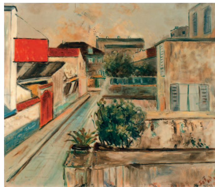
Calle de Paris , 1925