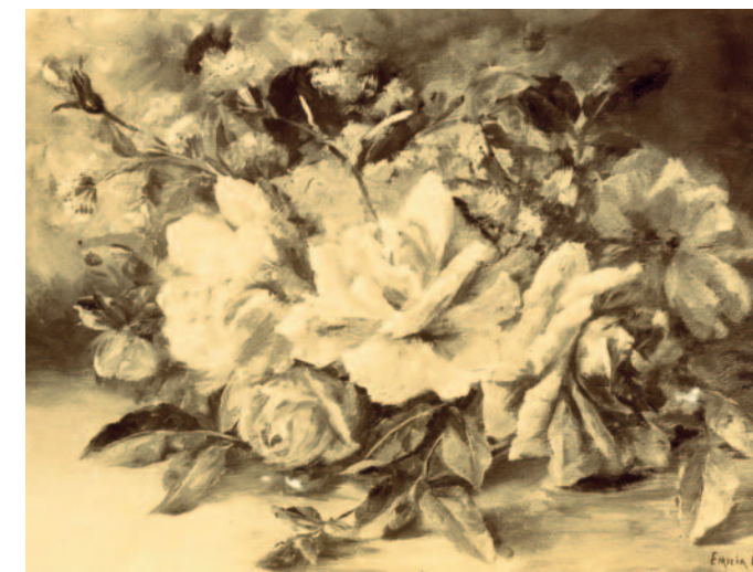
Quadro a l'oli, no datat