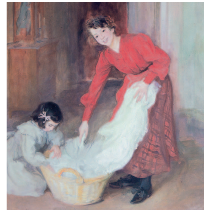
Les mestresses de casa, 1905