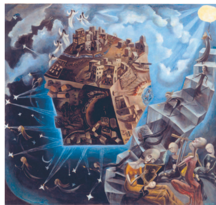
Un món , 1929