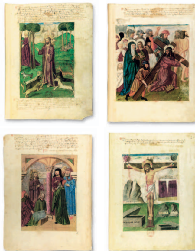
Il·lustracions de Speculum animae, segle XIV