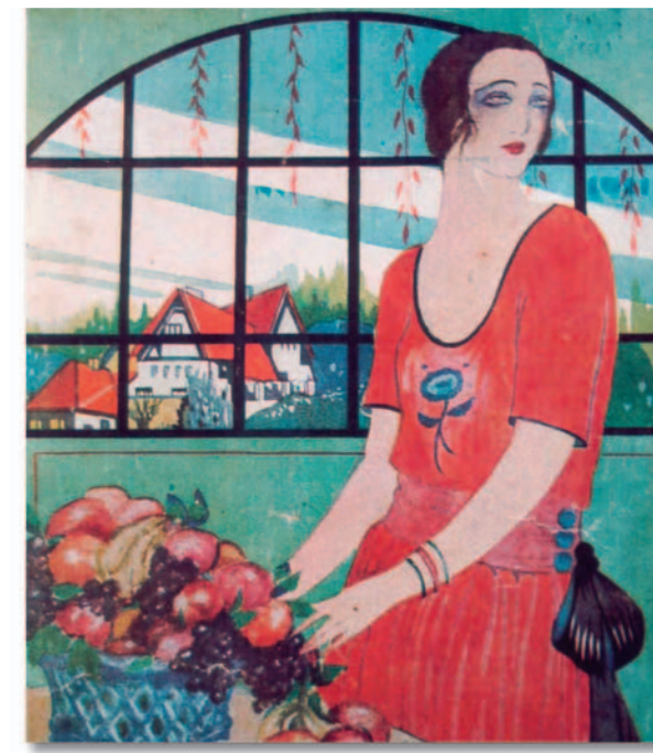
Portada d'Àci - d'Allà (fragment) , 1921