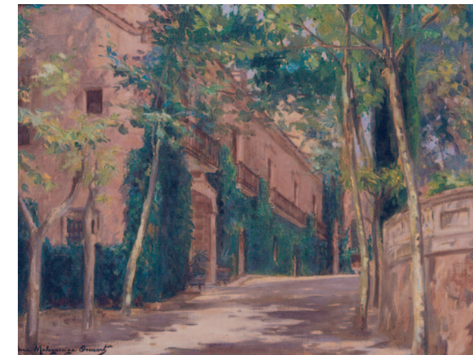
Passeig amb casa senyorial, no datat