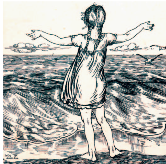
Il·lustració a Original de Margarida , 1928