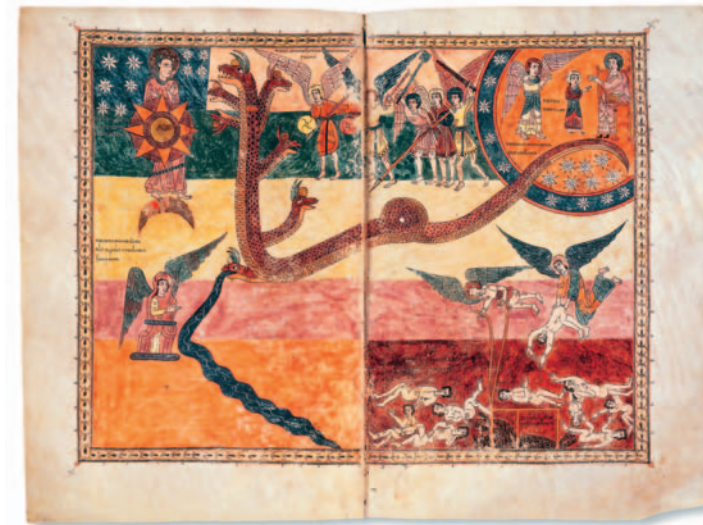
La batalla del drac amb el fill de la dona, segle XIII