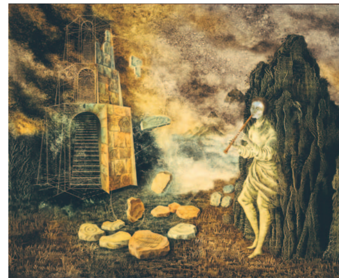
El flautista , 1955