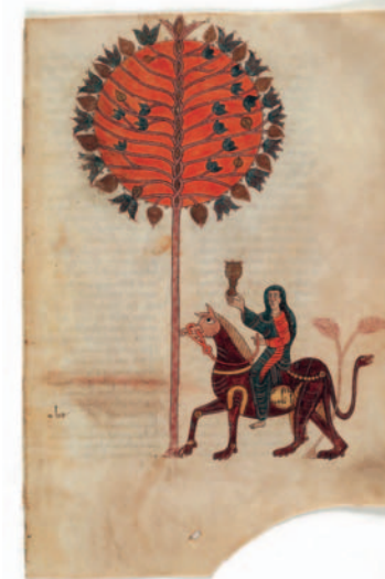
La dona asseguda sobre la bèstia, segle XIII

si que va deixar la seva signatura a les il·lustracions del Beatus de l'Apocalipsi de Girona , anomenat així perquè actualment es troba a la catedral d'aquesta ciutat. El Beatus va ser escrit entre els segles X i XI per un clergue anomenat Senior i il·luminat per Emetrio i Ende. Ende signa com " En depintrix et Dei Aiutrix ", identificant-se així com a pintora i ajudant de Déu. En aquestes il·lustracions Ende barreja la fantasia i la imaginació del llibre de l' Apocalipsi de Sant Joan amb una acurada atenció al detall naturalista. L'artista utilitza un estil de decoració plana, relacionada amb la il·luminació mossàrab, que combina figures estilitzades amb amples franges de colors vius i contrastats, que li permet aconseguir unes composicions molt expressives.