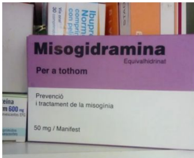
MISOGIDRAMINA 50 mg (Equivalhidrinato) Joana Baygual

"Después de centenares de años de opresión y gracias a miles de investigaciones en el entorno de esta cuestión, también desde el Laboratorio FemLab podemos confirmar la presencia de una grave patología social: la misoginia. Para hacer frente a su erradicación, FemLab a desarrollado la Misogidramina, con el principio activo de la equivalhidrinato. Juntamente con grandes dosis de humor e ironía, el equivalhidrinato activa los procesos reflexivos imprescindibles de estímulo del dialogo prudente y respetuoso necesarios para combatir esta patología y la injusticia social que genera".