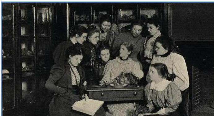
Изучение мозга. 1897 г.