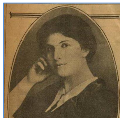
Русская крестьянская девушка из херсонской степи по фамилии Шапиро.

Затем она окончила московские педагогические курсы Общества воспитательниц и учительниц и получила российское гражданство, потом было поступление на